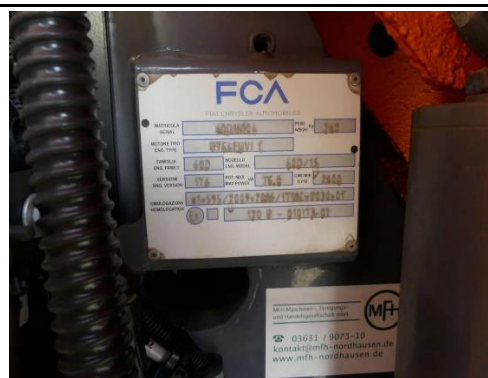
Ansicht Typschild Motor