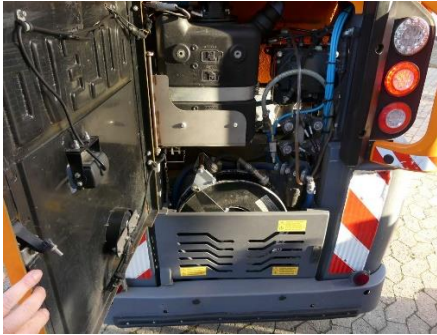
Ansicht Schlauchhaspel Hochdruckreiniger